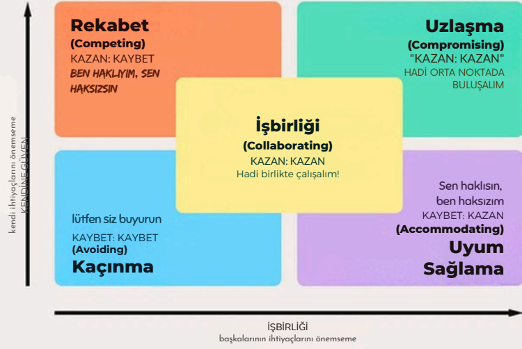
tablo: thomas-kilmann çatışma çözme stratejileri modeli